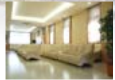
ゆったりとしたソファが配置され、明るいイメージの待合室。クラシックが流れて優雅な雰囲気です。