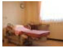
陣痛室と分娩室が一体化した「LDR」も3部屋完備。明るい室内は落ち着いた内装にまとめてあります。