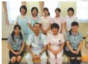
快適で心温まる診療がモットーのセブンベルクリニック。経験豊富なスタッフが「楽しい子育て」をサポートします。