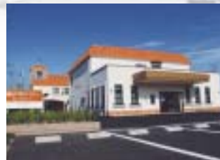
120台の駐車可能な広い敷地には、身障者用駐車スペースに屋根付き駐車場も完備しています。