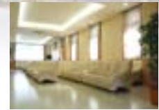
ゆったりとしたソファが配置され、明るいイメージの待合室。クラシックが流れて優雅な雰囲気です。