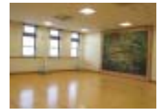
マタニティピクニックやマタニティヨガの教室を開催するなど、産前・産後のケアにも力を入れています。