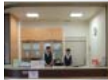
「快適で心温まる医療」をモットーとするセブンベルクリニック。笑顔でも迎えます。