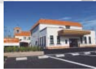
120台の駐車可能な広い敷地には、身障者用駐車スペースに屋根付き駐車輪も完備しています。