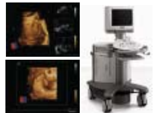
エコー健診では赤ちゃんの立体的な動きを動画で見ることが出来る最新の「4D」を設置しています。