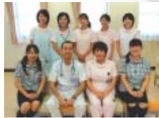
快適で心温まる診療がモットーのセブンベルクリニック。経験豊富なスタッフが「楽しい子育て」をサポートします。