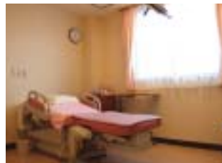
陣痛室と分娩室が一体化された「LDR」も3部屋完備。明るいうち室内は落ち着いた内装にまとまっております。