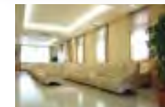
ゆったりとしたソファが配置され、明るいイメージの待合室。クラシックが流れて優雅な雰囲気です。