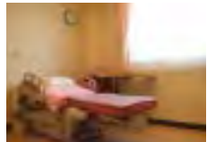
陣痛室と分娩室が一体化された「LDR」も3部屋完備。明るい室内は落ち着いた内装にまとめてあります。