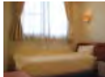
全室バス・トイレ付の完全個室型の病室も16部屋完備。当院専任シェフによるお食事にもご期待下さい。