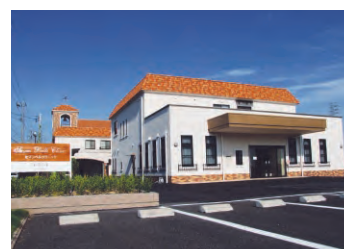
120台の駐車可能な広い敷地には、身障者用駐車スペースに屋根付き駐輪場も完備しています。