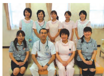
快適で心温まる診療がモットーのセブンベルクリニック。経験豊富なスタッフが「楽しい子育て」をサポートします。