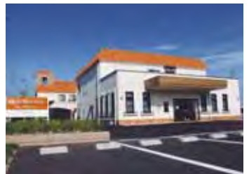
120台の駐車可能な広い敷地には、身障者用駐車スペースに屋根付き駐輪場も完備しています。