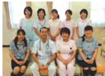
快適で心温まる診療がモットーのセブンベルクリニック。経験豊富なスタッフが「楽しい子育て」をサポートします。